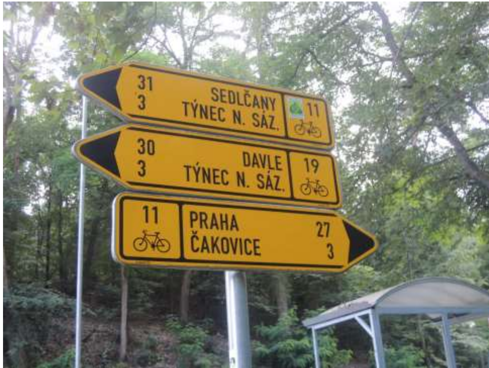
Sem jsme dorazili, cca 17:45