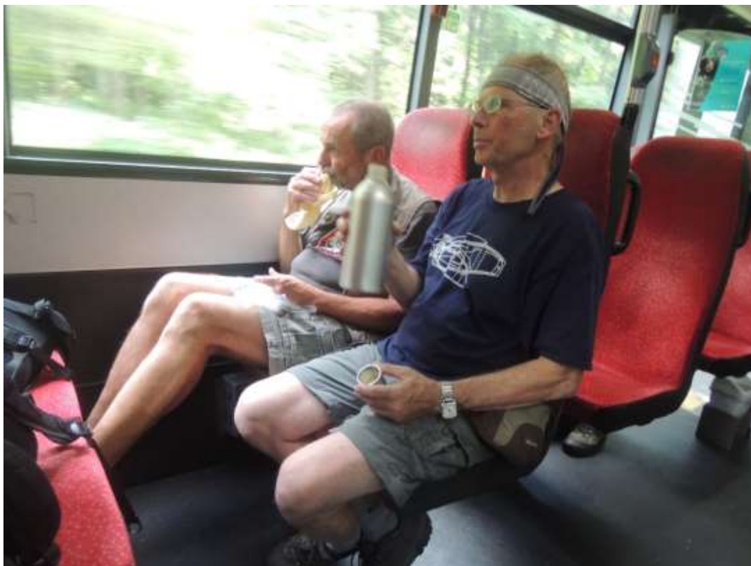
a občerstvení v drožce