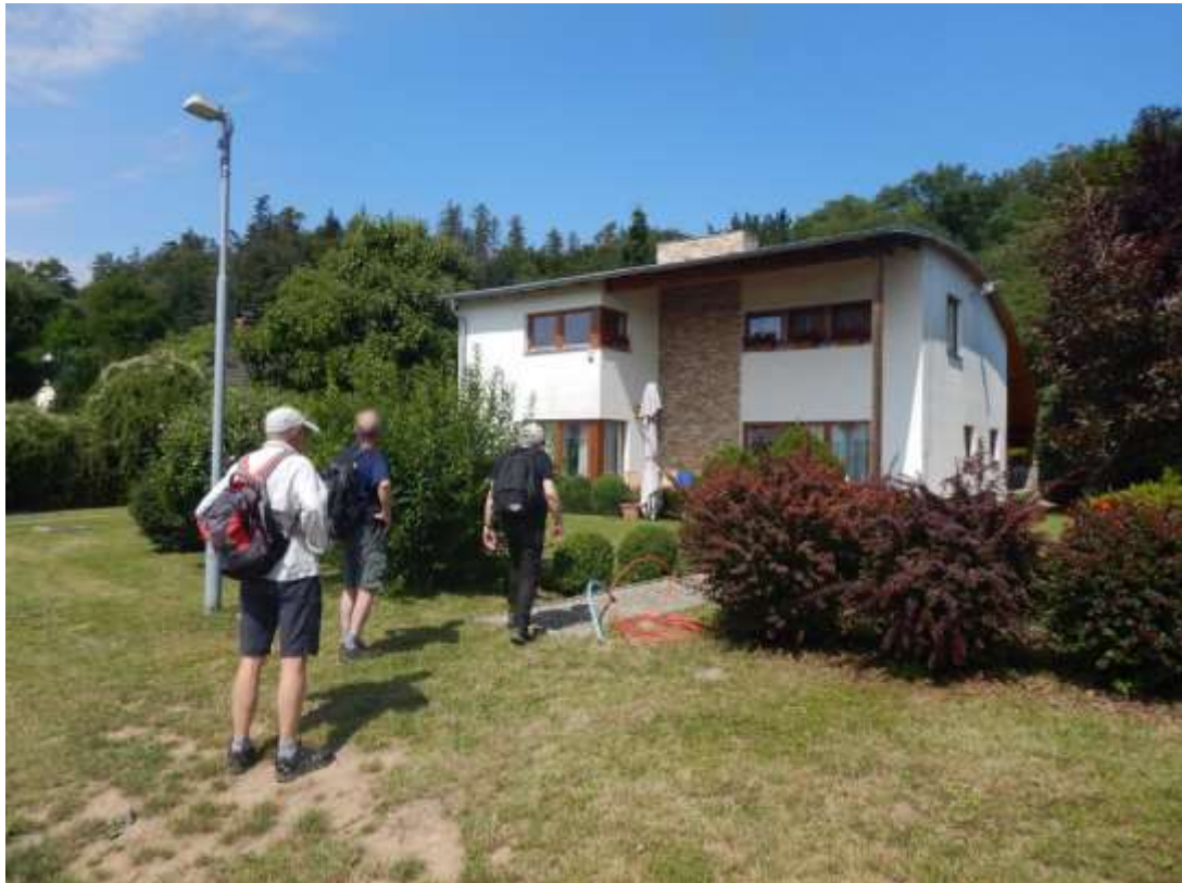
Dorazili jsme do Bobánkova