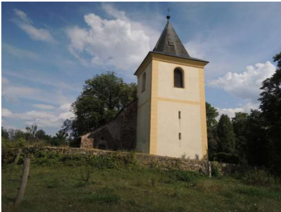
Ledecký kostelík se hřbitovem

Na výletě také fotografoval Mahu a své fotografie opatřil titulky