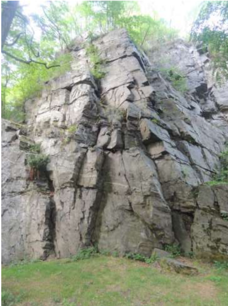
Skála pod hradem Zbořený Kostelec s rotundou (11. stol.