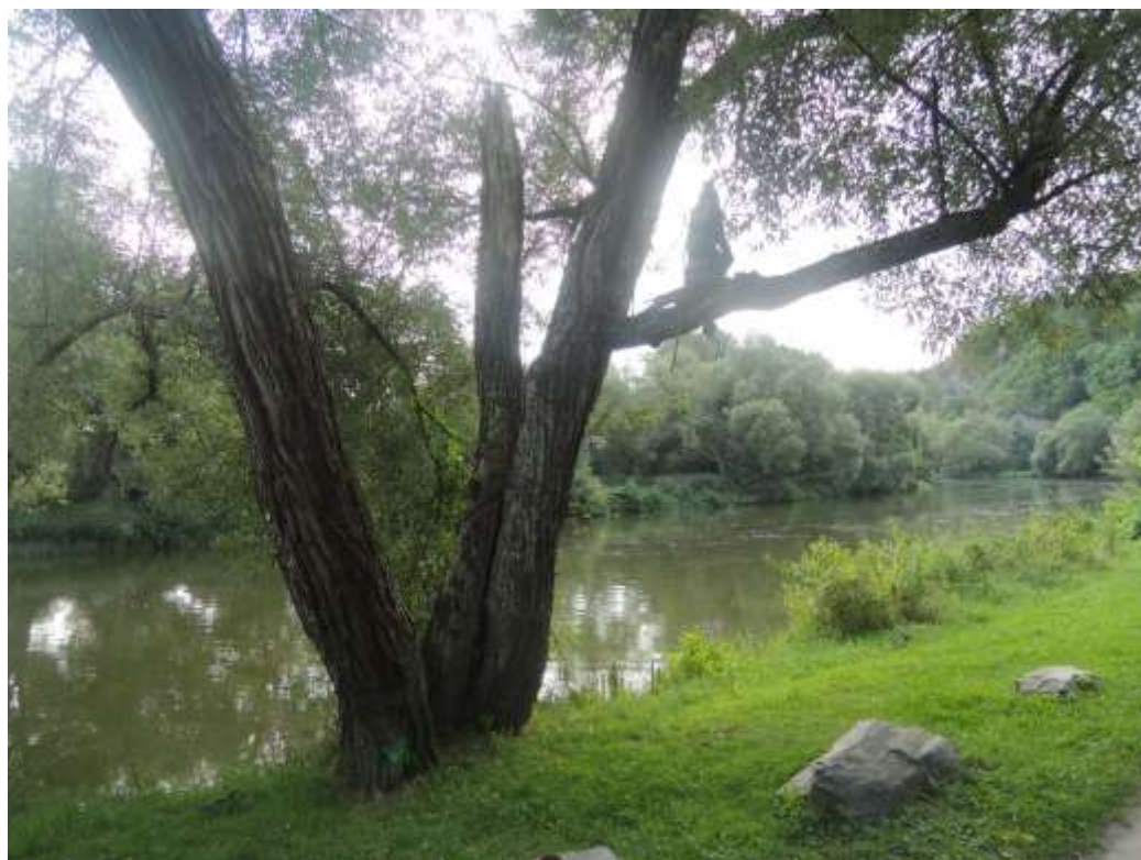
Kde je ale ledecký vodník?