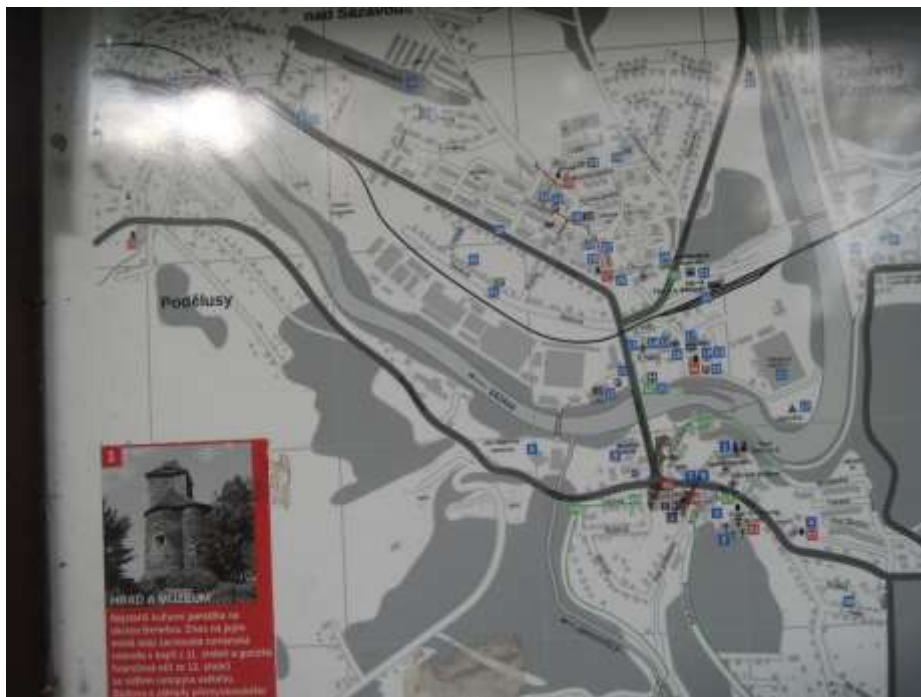
Plánek výletu a popis hradu, na výstup nezbyly síly ani čas