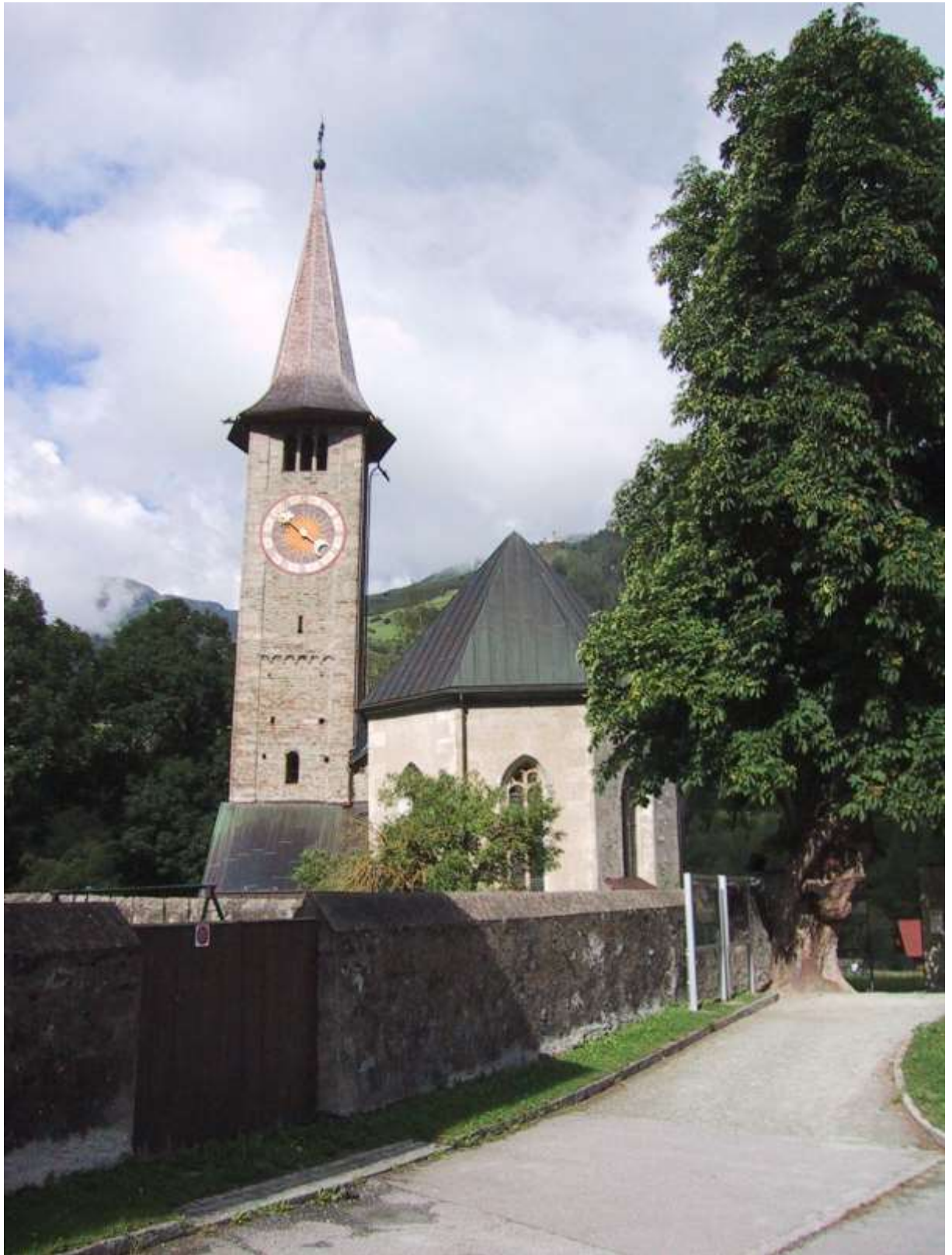
Kostel sv. Martina